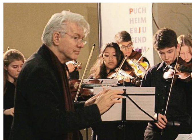
Das Puchheimer Jugendkammerorchester lädt ein zu einer Reise durch verschiedene Epochen und Stile.

Veranstalter: Alfredo Foulkes, mit Unterstützung der Stadt Puchheim PUC, Großer Saal Eintritt: 31 Euro; ermäßigt 26 Euro