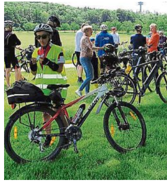
Kleiner Zwischenstopp auf der Auftakttour des Stadtradelns 2024 nach Jesenwang.

Mit dem Stadtradeln – einer Aktion des Klima-Bündnis – möchte die Stadt die Bürgerinnen und Bürger motivieren, verstärkt auf das Fahrrad umzusteigen und somit einen Beitrag zum Klimaschutz zu leisten. Neben der Auftakttour umfasst das Programm verschiedene Aktivitäten wie eine Schnitzeljagd, bei der die Teilnehmenden Fotos von Stadtradeln-Banner-Standorten dreier verschiedener Landkreiskommunen einreichen können und auch die Möglichkeit, über die Meldeplattform RADAR