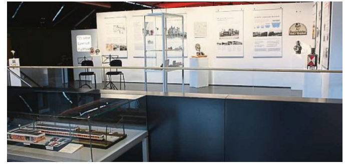
Die Ausstellung bot interessante Einblicke in die Geschichte der Eisenbahn.