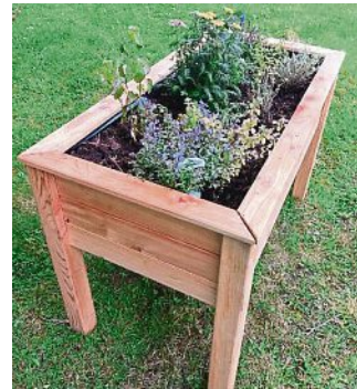
Bepflanztes Hochbeet zum Abschluss der Ausstellung „Bayern summt“ am 15. Juni.