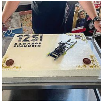
Die „Geburtstagsorte“ zum Jubiläum 125 Jahre Bahnhof.